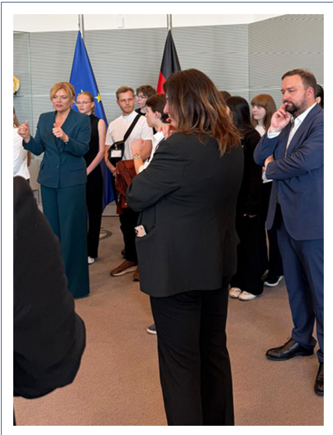
Mit vielen interessierten Besuchern im Bundestag zum Tag der offenen Tür

Beim Tag der offenen Tür im Deutschen Bundestag stand in diesem Jahr besonders im Mittelpunkt, Politik für Kinder und Familien erlebbar zu machen. Ich war den Tag über im Parlament vor Ort, habe viele Besucherinnen und Besucher aus Thüringen getroffen und zahlreiche Gespräche geführt, gerade mit jungen Gästen, die neugierig gefragt haben, wie der Bundestag arbeitet und wie Gesetze entstehen.