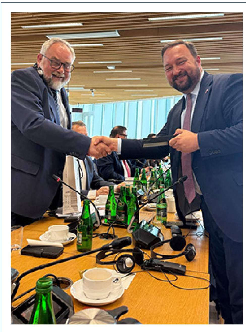
Interessanter Austausch in Warschau mit dem Ausschuss Kultur und Medien